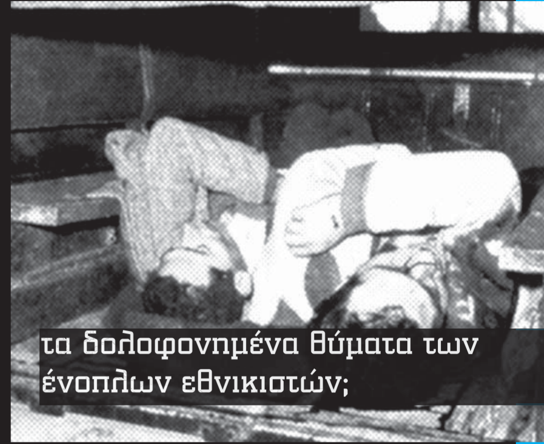
τα δολοφονημένα θύματα των ένοπλων εθνικιστών;